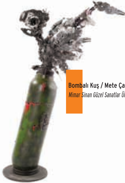
Bombalı Kuş / Mete Çam Mimar Sinan Güzel Sanatlar Üniversitesi