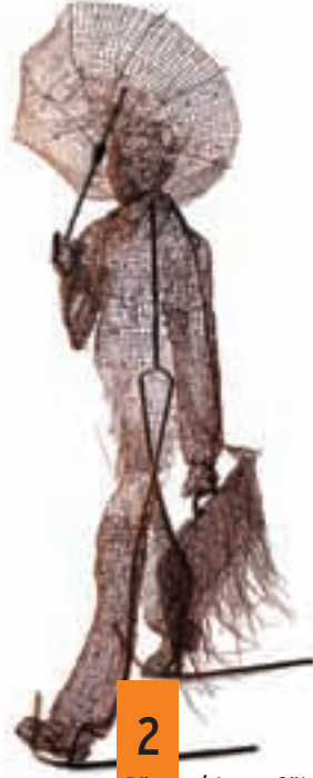
Dönüşüm / Nergiz Yeşil Mimar Sinan Güzel Sanatlar Üniversitesi