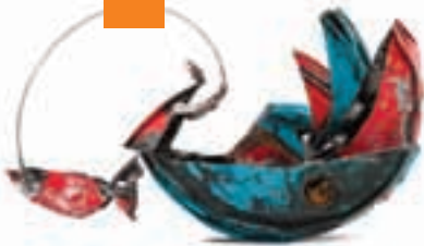
Kirli Balık / Uğur Savaş Mimar Sinan Güzel Sanatlar Üniversitesi