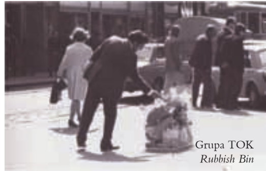
Grupa TOK Rubbish Bin