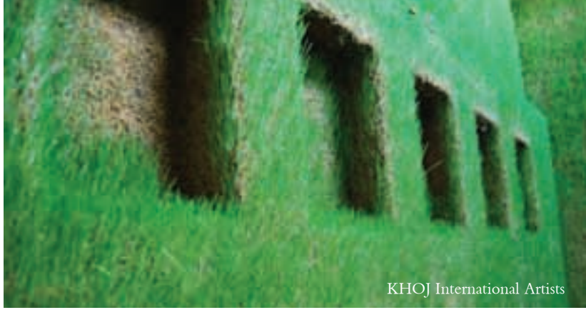
KHOJ International Artists