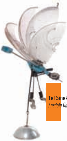
Tel Sinek / Maide Ayas Anadolu Üniversitesi Güzel Sanatlar Fakültesi