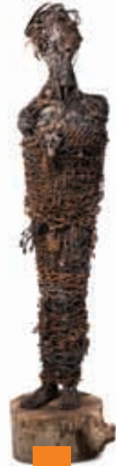
Kadına Şiddet / Ramazan Duymaz Selçuk Üniversitesi Güzel Sanatlar Fakültesi