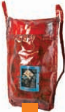
Kırmızı Çanta / Raşide Bakış Atatürk Üniversitesi Güzel Sanatlar Fakültesi