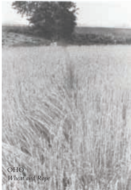
OHO Wheat and Rope

“ Bazı sanatçıların, sanatsal objelerin üretimi ve depolanmasını reddetmesi, kavramsal sanatın önceliklerinde deęişikliğe neden oldu ”