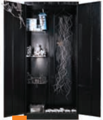
İstanbulboğulkaotik / Ezgi Sönmez Marmara Üniversitesi Güzel Sanatlar Fakültesi