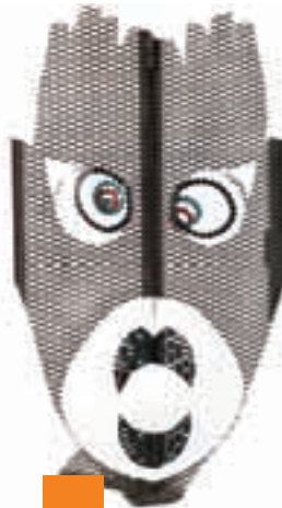
Oryantal Delta Ruhü / Silacan Köşeler Mimar Sinan Güzel Sanatlar Üniversitesi