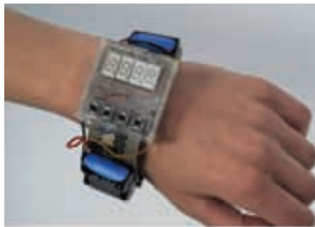
JaneK Simon How to Make a Digital Watch

“ Bazı sanatçıların, sanatsal objelerin üretimi ve depolanmasını reddetmesi, kavramsal sanatın önceliklerinde deęişikliğe neden oldu ”