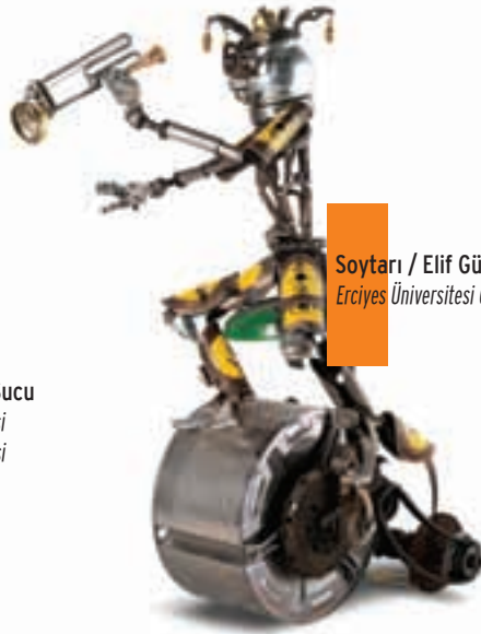
Soytarı / Elif Gülün Durmaz Coşkun Erciyes Üniversitesi Güzel Sanatlar Üniversitesi